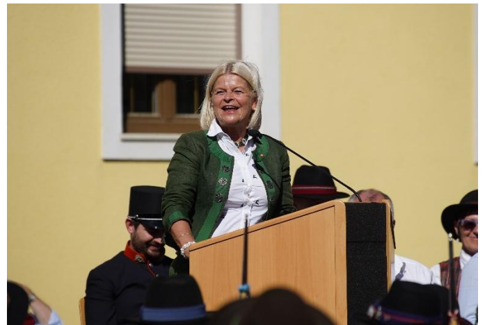
Verteidigungsministerin Klaudia Tanner