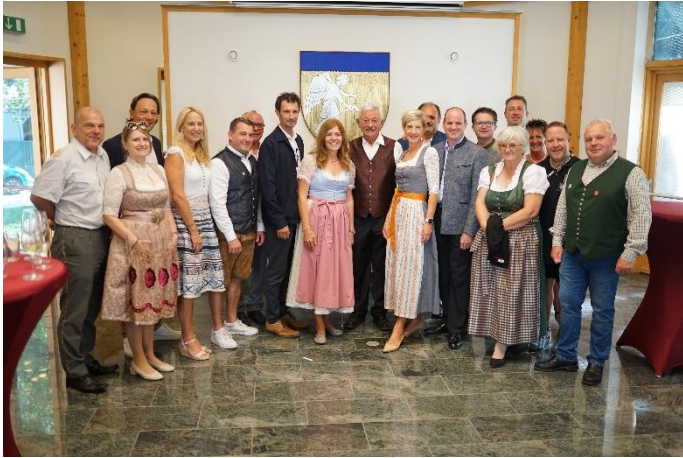
Empfang der Ehrengäste

Danke an alle, die zum Gelingen dieses Festes, das auch ein Aushängeschild unserer Gemeinde war, beigetragen haben! Danke an die Marktgemeinde Weikendorf für die Unterstützung durch die Übernahme der Kosten für das Festzelt!