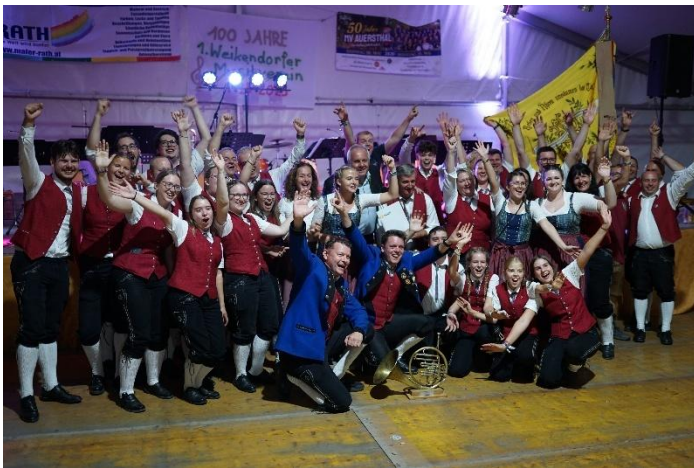
Die Sieger des Tages: „MV Auerthal“